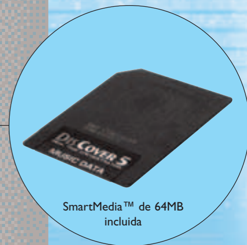
SmartMedia™ de 64MB incluida

Si el criterio de búsqueda no le resulta familiar, siempre puede utilizar la función Play & Search : basta con tocar en el teclado la melodía principal de la canción deseada y DisCover 5 la encontrará por usted.